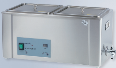
SONIRET RP COOL I HEAT Ultraschallgerät Best.-Nr. COOL: 10200005 Best.-Nr. HEAT: 10200006