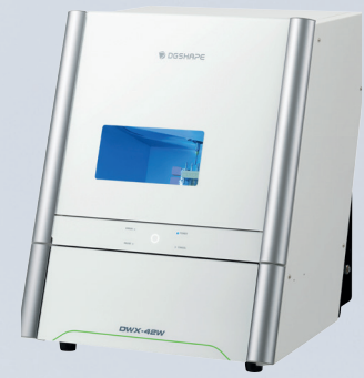
ANYCAM 42 W Nass-Fräseinheit Best.-Nr.: 58503000