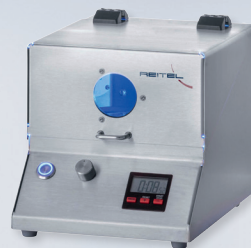
POLYURE Lichthärtegerät Best.-Nr.: 18310000