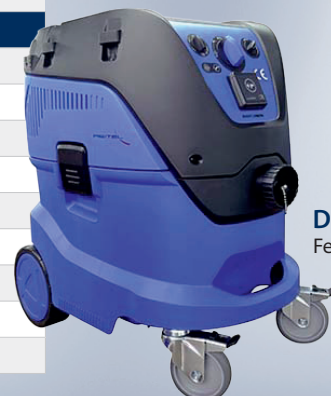
Dusty Zirkon Feinstaubsauger

Bei dem ERGORET COMFORT von REITEL handelt es sich um eine Art Schutzhaube für alle zahntechnischen Arbeiten, bei denen Schmutz, Staub und Dampf entsteht. Die abnehmbare Haube aus Sicherheitsglas schützt Sie dabei vor dem Einatmen solcher Stoffe und trägt so wesentlich zu Ihrer Gesundheit im Zahnlabor bei.