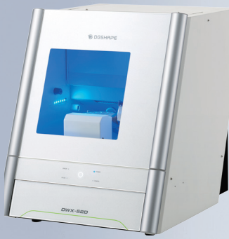
ANYCAM 52 Trocken-Fräseinheit Best.-Nr.: 58501400