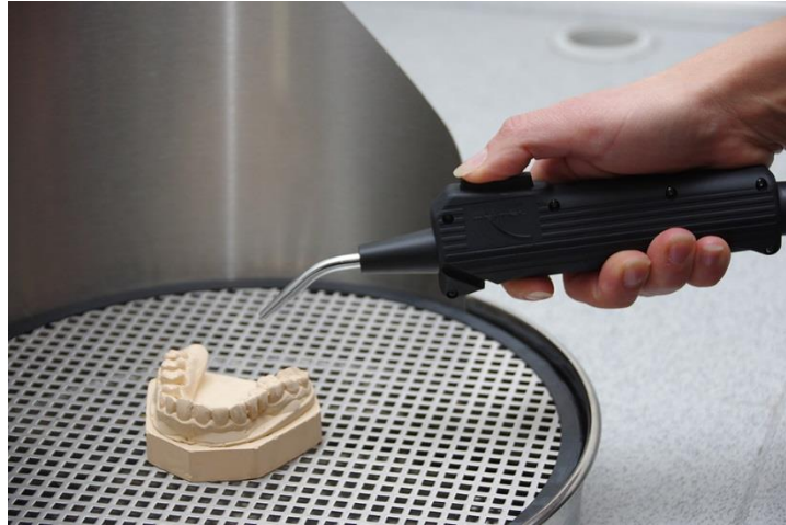
Abb.: Haltung der Pistole für schnelle Bedienung und hohe Ergonomie