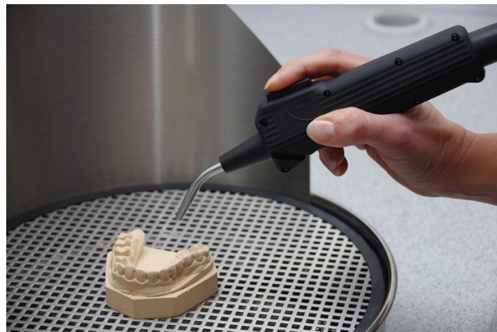
Abb.: Haltung der Pistole für detaillierte Reinigung und Halterichtung nach unten